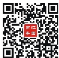
江西商务微信二维码