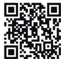
江西招商引资网二维码